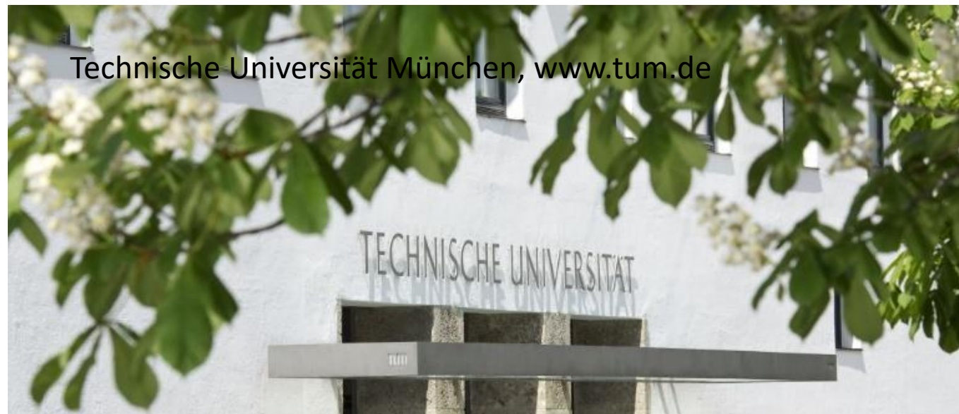
Technische Universität München, www.tum.de