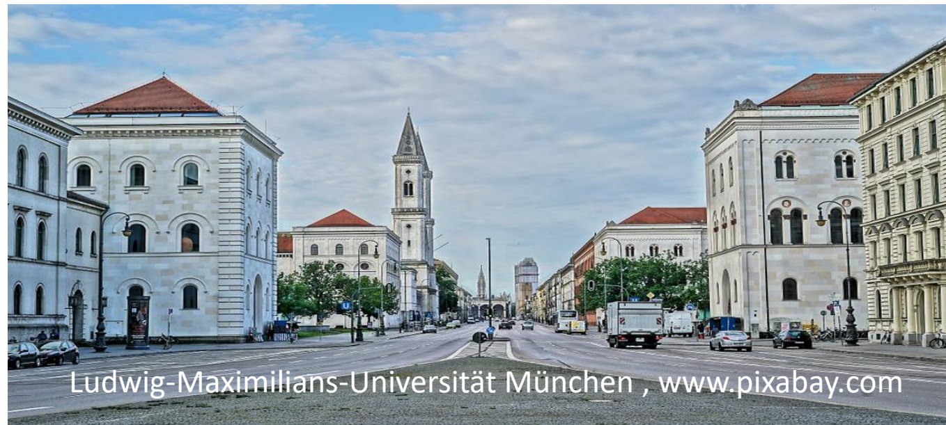
Ludwig-Maximilians-Universität München